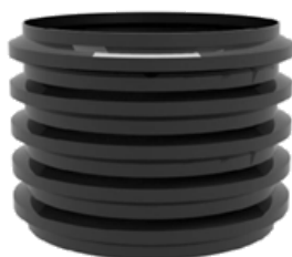
Nástavec k nádržím SMART