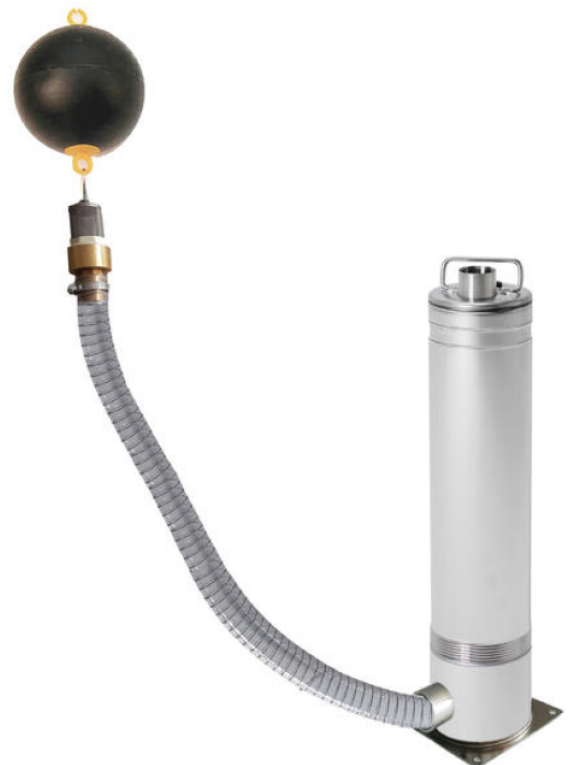
iDiver inox plus L