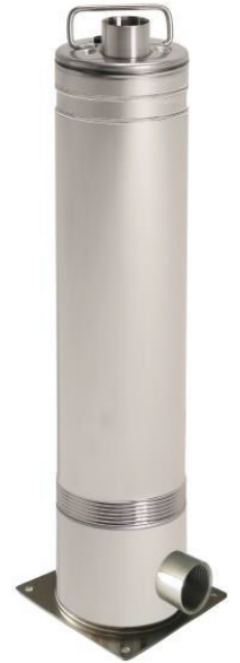
iDiver inox plus S