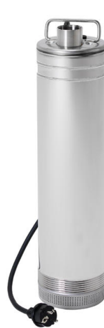
iDiver inox basic